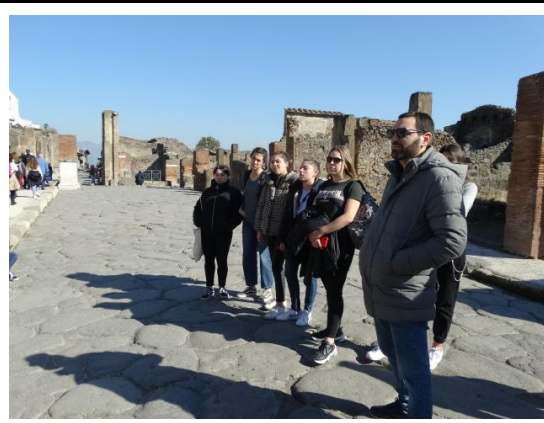
Ruïnes de Pompeia