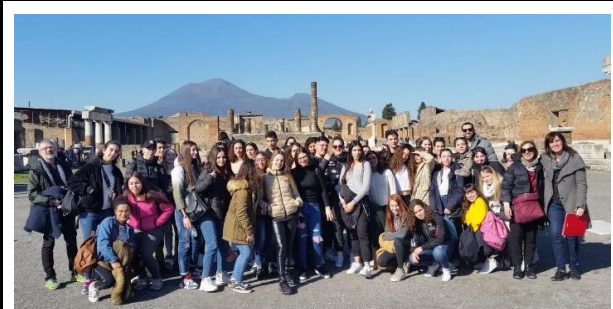
Fòrum de Pompeia, amb el Vesubi al fons.