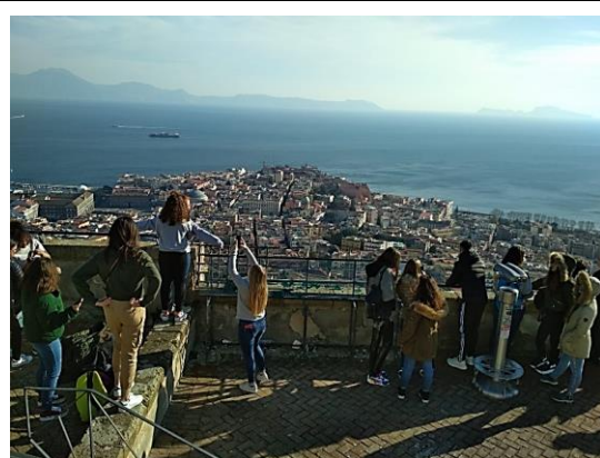
Vista de la badia de Nàpols des del Castell de Sant Elmo, amb vistes a l'illa de Capri a la part superior dreta de la foto.