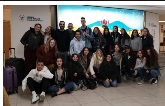
Arribada a l'aeroport de Nàpols.

En les fotos podreu veure algunes de les imatges d'aquesta bella regió d'Itàlia.