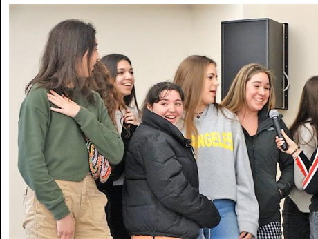
Presentació al Liceo el dia de l'arribada.